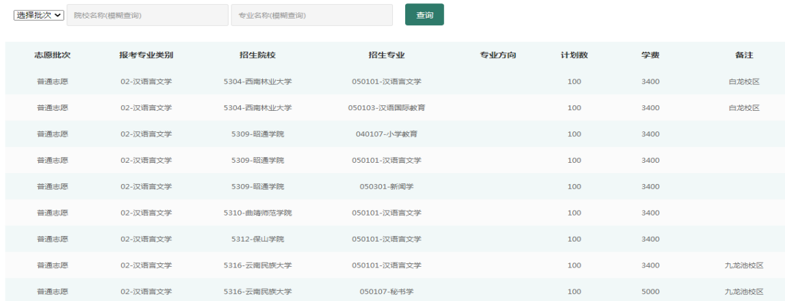
图 6 报考专业类别所有计划查询页面

点击图 4.1 或 4.2 中的【查询报考专业类别所有计划】，打开页面，如图 6 所示，考生可查看专业类别的所有计划，可根据批次、院校名称、专业名称等条件查询计划。