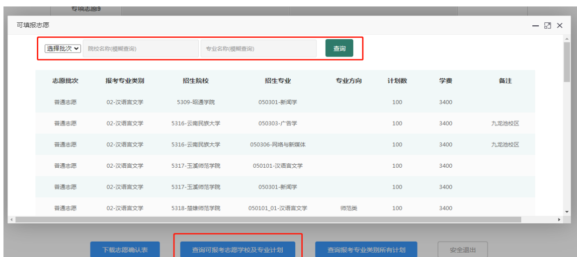
图 5 可报考志愿学校及专业计划查询页面

点击图 4.1 或 4.2 中的【查询可报考志愿学校及专业计划】，弹出可报考的计划，如图 5 所示，考生可查看可报考的计划内容，可根据批次、院校名称、专业名称等条件查询可报考计划。