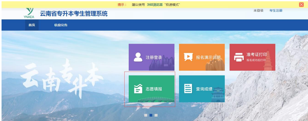
图 1 首页

进入网址后，点击图 1 页面中【志愿填报】按钮后，进入到登录页面，如图 2，按照要求填写。志愿填报时请使用电脑端进行网上填报志愿，不要使用手机等移动终端填报。