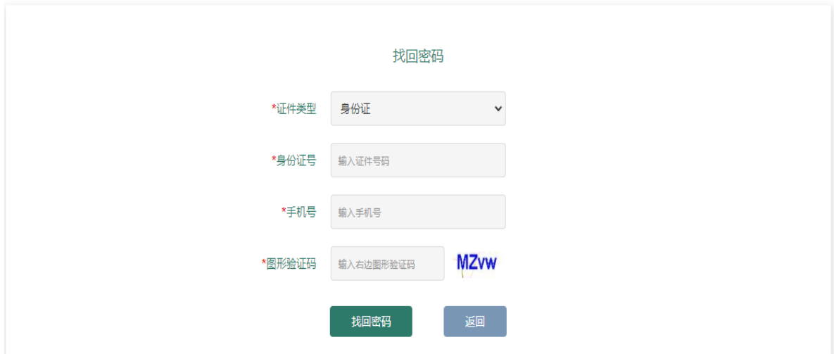
图 12 找回密码页面