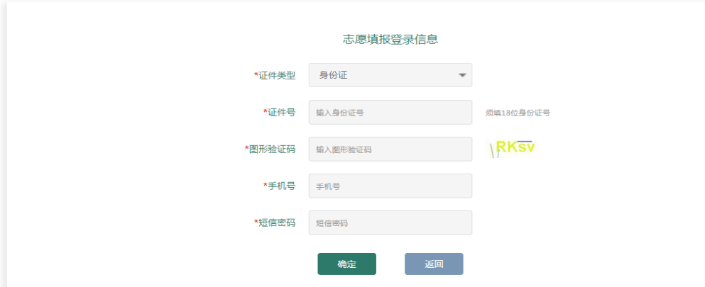
图 11 志愿填报页面