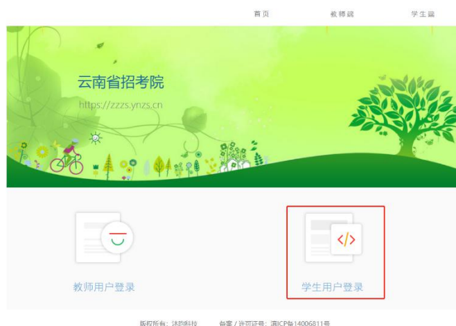
图 1 云南省招考院首页