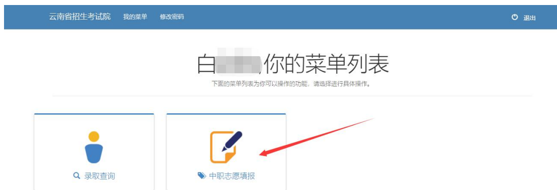
图 5 菜单选择页面

步骤 3，进入系统后，学生在 五年制普通批，中职普通批，高职专项批（建档立卡贫困户）中选择批次进行填报，其中 高职专项批仅建档立卡贫困户可以填报 。